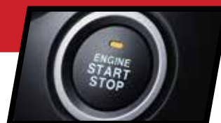
СТАРТ-СТОП систем за палење на возилото