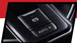
Електронска рачна сопирачка со „AUTO HOLD“ опција