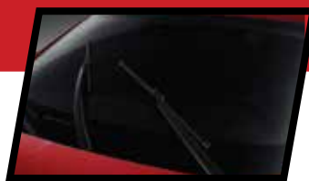
СЕНЗОРИ ЗА ДОЖД

ЦЕЛОСНИ LED СВЕТЛА LED предни светла, LED трепкачи на ретровизори, Дневни LED светла, LED задни светла, LED предни и задни магленки.