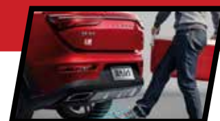
Далечинско отварање на багажната врата