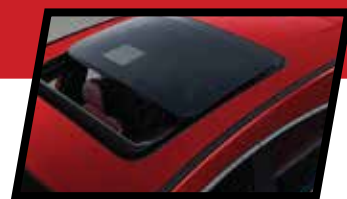
ПАНОРАМСКИ СОНЧЕВ КРОВ

F5 е динамичен и див “Coupe” тип на SUV кој му овозможува на патникот чувство на луксуз и удобност во комбинација со спортско искуство при управувањето. Оригинален и уникатен дизајн со препознатливата “Starry” предна решетка дополнително го зацврстува силниот карактер на F5. Спортскиот и динамичен изглед дополнително е збогатен со 18 инчни алуминиумски фелни.