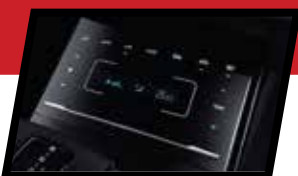
Подесување на температура со екран осетлив на допир